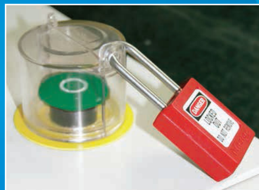
S2151 sécurisé à l'aide d'un cadenas S31RED.